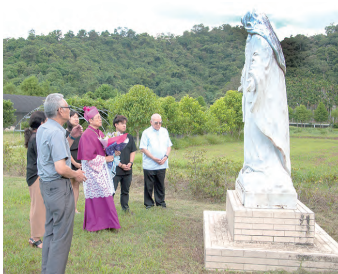
▲鍾安住總主教至聖母護校參訪，為校園中的聖母態像獻花敬禮。