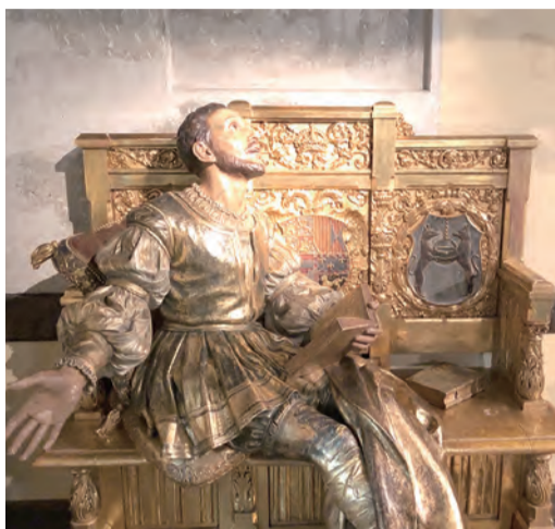
▲養病時仰望天主的聖依納爵