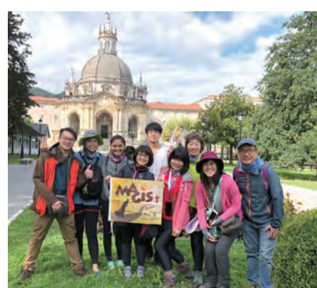
▲Magis朝聖青年於羅耀拉大殿前喜樂合影