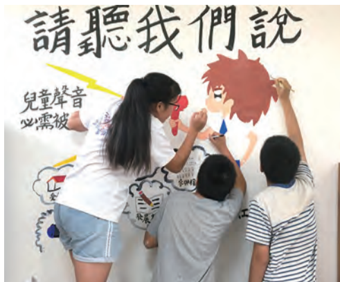
▲善牧台中新住民家庭服務中心新二代共同創作象徵表意權的「請聽我們說」彩繪牆。