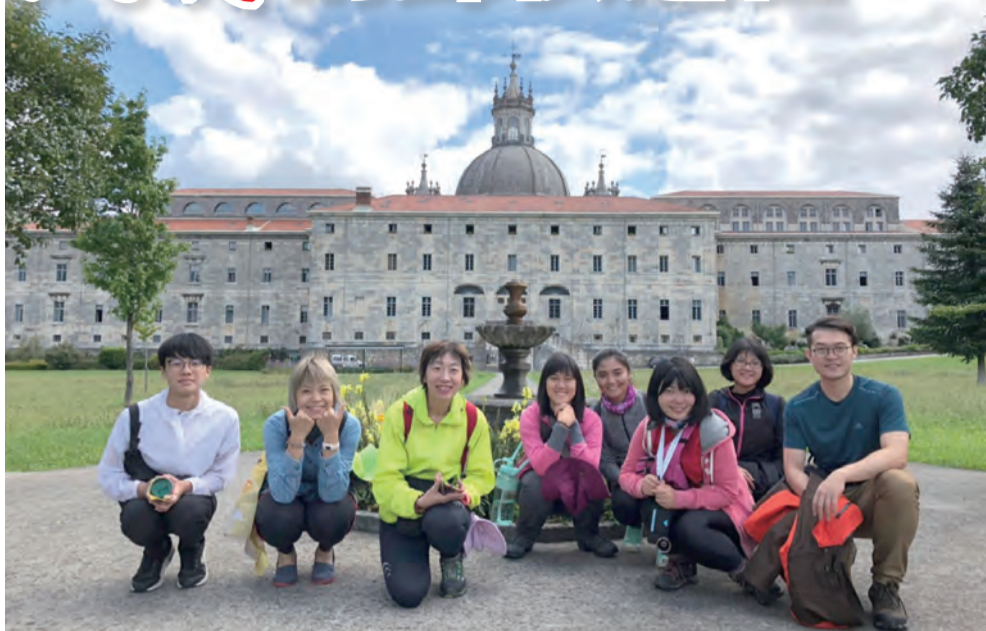
▲羅耀拉大殿旁的避靜院