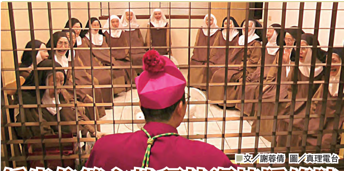
文/謝蓉倩 圖/真理電台

中華郵政台北雜字第1304號執照 發行人:洪山川/地址:(106)台北市樂利路94號/電話:(02)2737-2839/傳真:(02)2737-1326/電子郵件:catholicweekly@gmail.com