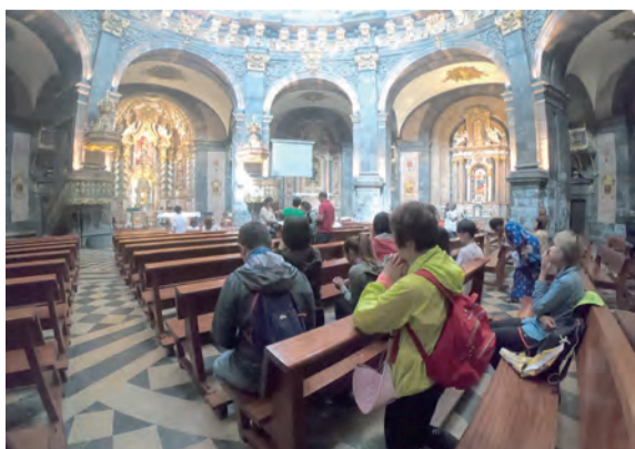
▲聖依納爵大殿內虔心祈禱，沉澱心靈。

他，依納爵，跛腳的司鐸，如今充滿智慧，終於明白自己的救贖不僅是砲彈擊碎了自己的虛榮與驕傲，而是因為耶穌基督在許多年前，就已應允了一位老姑媽對姪子永恆的愛。祂早已答應她，自己會牽著這浪蕩子慢慢站起，馱著他遠離殺戮，陪他在洞裡度過恩賜與劫難，一起赤腳走向更燦爛的未來。