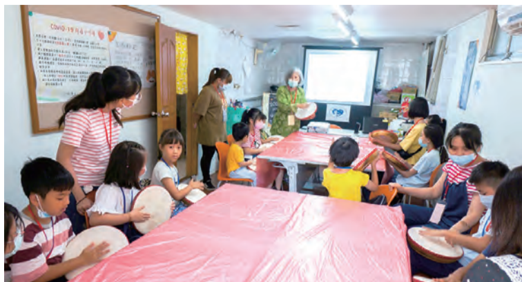
▲善牧培新中心新住民二代學習打擊馬來羊皮鼓。 ▶善牧培新中心新住民二代指甲花彩繪成果。