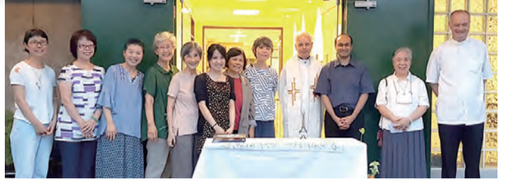
▲新辦公室祝聖禮與靈修中心團隊