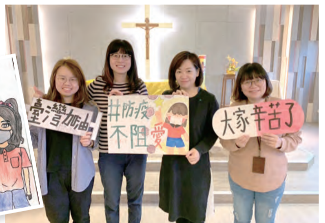
▲「防疫不阻愛」行動開跑，振聲中學師生踴躍參與並認真執行。