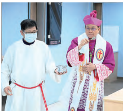
▲鍾安住總主教為新裝設完成啟用的門診區灑聖水祝福