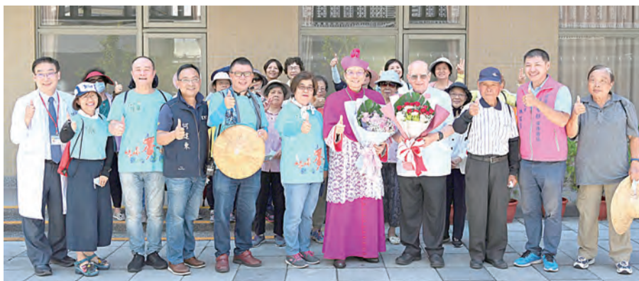
▲呂若瑟神父、羅東鎮長以及鎮民歡迎鍾安住總主教蒞臨宜蘭參訪，歡喜合影。

感謝天主，賜給我們親切、體貼的鍾總主教，所有需求的聲音都能被聽見，所有渴望的心靈都能被滿足，這是全體教友的福音，更是靈醫會的福氣，願天主的恩寵賜給鍾總主教更多的能量，帶領全體教友在不平靜的時代，身心更加安定，台灣，愈來愈幸福！