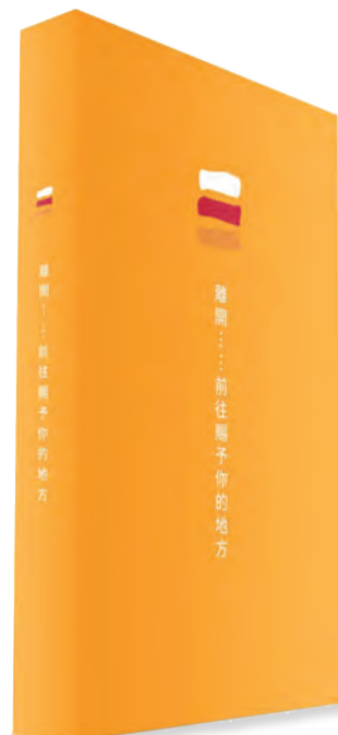
▲青年們參與依納爵古道朝聖之後，出版了《離開……前往賜予你的地方》新書，封面樸實，內在豐美！

主曆1521年，聖依納爵·羅耀拉在戰場上被砲彈擊傷右腿，因而與天主相遇。翌年，悔改歸依的依納爵離開家族城堡，走向天主為他預備的朝聖之路，成就更寬廣的夢想。2019年，11名港澳台青年被「離開……前往賜予你的地方」所觸動，決定離開舒適的生活，遠赴西班牙，走上從羅耀拉(Loyola)到曼雷薩(Manresa)的「依納爵朝聖之路」。徒步8天走過120公里，先後前往法國露德和西班牙蒙塞拉特(Montserrat)朝聖，最終到達曼雷薩避靜，整理在朝聖路上與天主相遇的經驗。從出發，到走在路上，再回到日常生活中，每位「朝聖者」在萬事萬物中找到天主，得著「更」的動力，不斷前行。