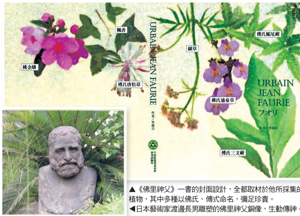
▲《佛里神父》一書的封面設計，全都取材於他所採集的植物，其中多種以佛氏、傅氏命名，彌足珍貴。 ▲日本藝術家渡邊長男雕塑的佛里神父銅像，生動傳神。

今年是《願祢受讚頌》宗座通諭頒布第5周年，天主教會於5月16-24日以「萬物互相關聯」為主題舉辦「願祢受讚頌周」活動，教宗邀請全球各堂區、教區、修會、社團、學校和其他機構省思這個主題，並加強對拯救受造界和促進整體生態的承諾。台灣天主教會以修會會長聯合會為主推動「願祢受讚頌周」，並於5月24日中午與全球一同祈禱。教宗於24日當天宣布開啟特殊周年「照顧共同家園年」至2021年5月24日，普世教會在這期間將進行許多明確強調「生態歸依」的活動，邀請眾人對照料受造界進行省思。