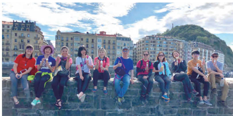
▲經過巴斯克自治區Donostia，駐足享受片刻的悠閒，清涼消暑。