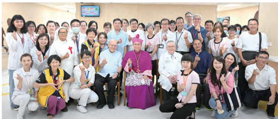
▲聖母大家庭與鍾安住總主教於全新門診區合影