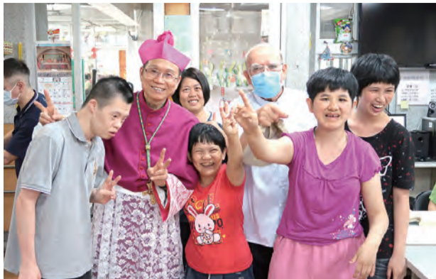
▲鍾安住總主教於羅東聖母醫院聖心堂主禮感恩彌撒 ▲鍾安住總主教與聖嘉民啟智中心的天使寶貝們歡聚