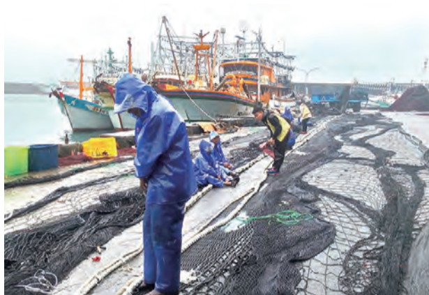
▲海員和漁民討海人生，長期遠離家鄉。

既然世界上百分之90以上的貿易都是由船舶運輸而實現，我們的社會對海運業的依賴便無庸置疑。沒有海員，全球的經濟將會停滯不前；而沒有漁民，世界上許多地方將遭受飢餓。我想請各位向所遇到的海員和漁民表達我的敬意和鼓勵，他們當中許多人為工作，長期遠離故鄉家人千萬哩。