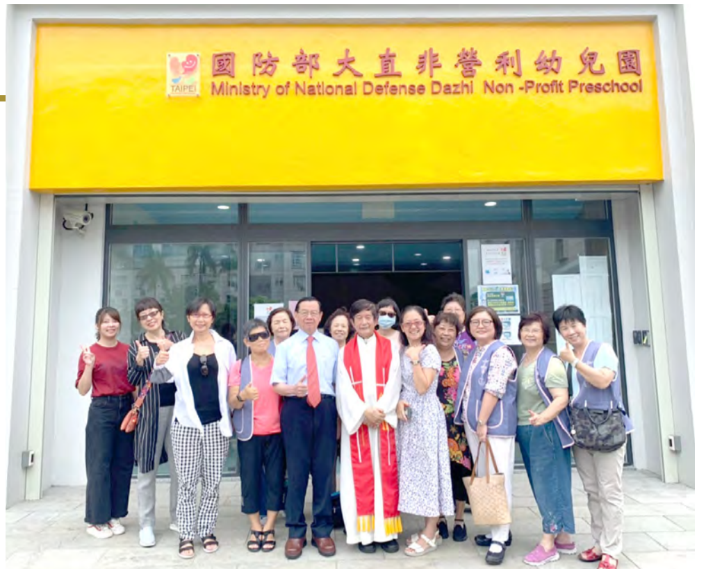
▼聖歌祝禱，其樂融融，祝福滿滿。